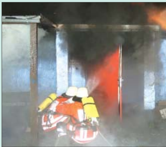
Drei Wehren vor Ort: Kräfte aus Meine, Wedesbüttel und Wedelheine sowie Rötgesbüttel löschten den Brand im Hühnerstall.

Vielmehr verweist er darauf, dass erste Ermittlungen auf einen Brandausbruch im Bereich eines Fernsehgerätes deuten. Doch es sei auch noch zu früh, einen technischen Defekt als gesichert anzusehen. „Wir ermitteln in alle Richtungen.“ Dass ein Brandmittelpfeiler und auch ein technischer Schnüffler zum Einsatz gekommen sind, ist laut Schmidt reine Routine.