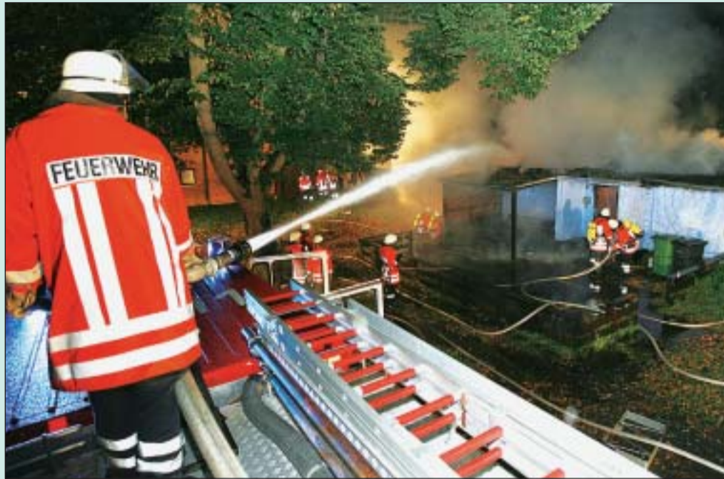
Einsatz für 47 Feuerwehrleute: Doch beim Großbrand des Meiner Jugendclubs Hühnerstall gab es nichts mehr zu retten.

„Das ist eine Lücke, die schnell geschlossen werden muss“, sagt deshalb auch Alt-Bürgermeister Hans-Georg Reinemann, der vor kurzem erst in Eigenregie mit den Eigentümern des Clubhauses eine Fristverlängerung bis April 2008 ausgehandelt hatte (AZ berichtete). Deshalb appelliert er an alle Meiner, anzupacken und sich nicht gegen ein neues Domizil der jungen Leute zu sperren.