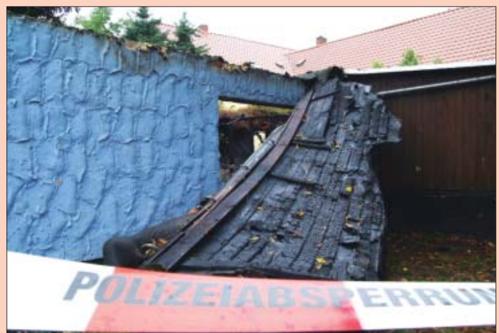
Ein schwerer Verlust: Der Großbrand im Clubhaus hat den Jugendclub Hühnerstall schwer getroffen. Die Mitglieder fürchten um den Fortbestand der Gemeinschaft.